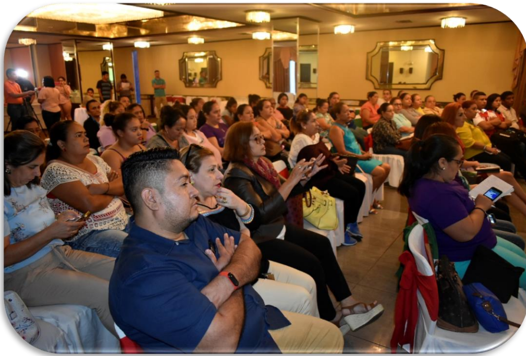
Panorámica de la audiencia al Foro: Mitos y Verdades sobre la situación de Salud de las Trabajadoras de la Maquila en Honduras