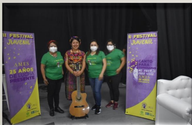
Cantante Maya Kaqchikel Ch'umilkaj e integrantes de AMES Guatemala