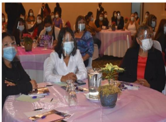
Mujeres trabajadoras de la industria textil en el IV CONGRESO DE TRABAJADORAS SALUD Y SEGURIDAD OCUPACIONAL, MEDIDAS A TOMAR FRENTE AL COVID 19