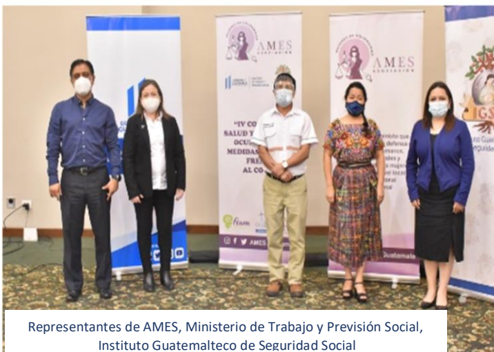
Representantes de AMES, Ministerio de Trabajo y Previsión Social, Instituto Guatemalteco de Seguridad Social

La Asociación de Mujeres en Solidaridad, realizó el IV Congreso de Salud y Seguridad Ocupacional medidas a tomar frente al #COVID19