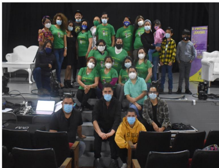
Transmisión en vivo II Festival Juvenil Canto para Expresarme, Me protejo para vivir, 25 años Lucha