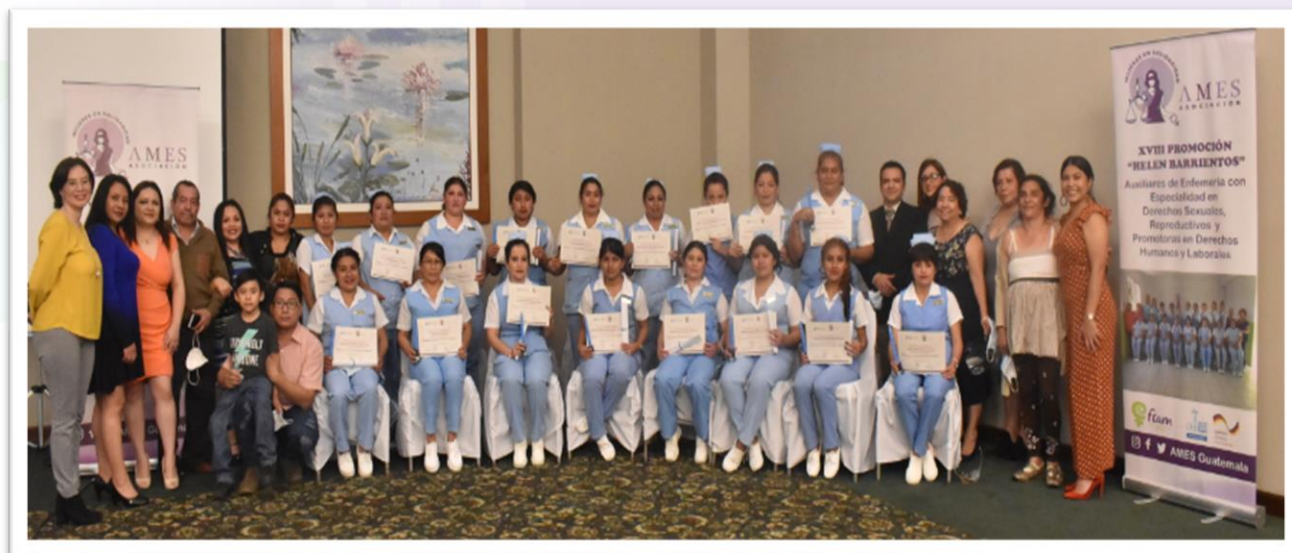
“XVIII Promoción Helen Barrientos”

El 20 de diciembre de 2020, se realizó la graduación de Promotoras en Derechos Humanos y Laborales y Auxiliares de Enfermería con Especialidad en Derechos Sexuales, Reproductivos, desarrollado con el apoyo y coordinación financiero del Ministerio Federal de Cooperación Económica y Desarrollo (BMZ); Iniciativa Cristiana Romero de Alemania (ICR) y el Fondo Centroamericano de Mujeres (FCAM).