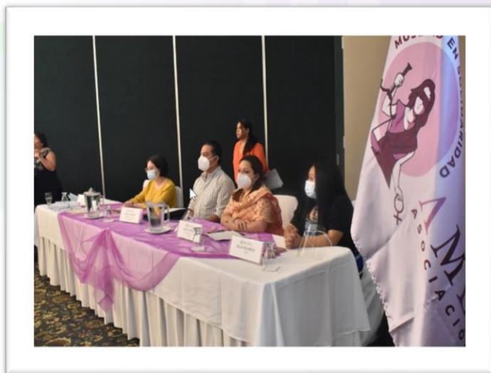
Autoridades AMES, FCAM y Ministerio de Trabajo y Previsión Social

La certificación les permitirá contar con el reconocimiento como Defensoras y Promotoras en sus centros de trabajo y a nivel comunitario. Seguidamente se realizó el acto de Graduación de Auxiliares de Enfermería, diploma que les permitirá laborar como Enfermeras en cualquier hospital privado y en sus comunidades o centros de trabajo.