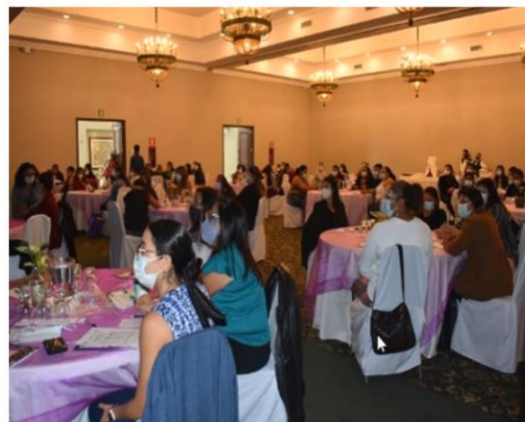
Integrantes de diferentes organizaciones de sociedad civil

¡Derecho que no se conoce no se exige. Todas juntas contra el COVID 19!