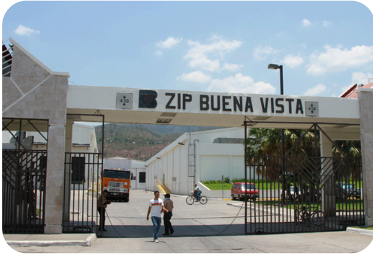
Fachada de la Zona Franca Buena Vista, Honduras.

Las maquilas Delta Apparel Honduras y Delta Cortés, ubicadas en Villanueva, Cortés, notificó el siete de junio de 2024, la suspensión de labores a 2,500 personas, durante 120 días, argumentando dificultades debido a la situación económica que afronta la empresa (1).