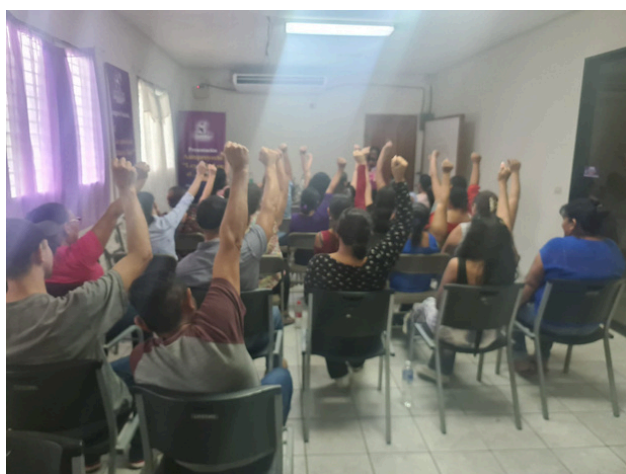
Trabajadoras de maquila en proceso de capacitación